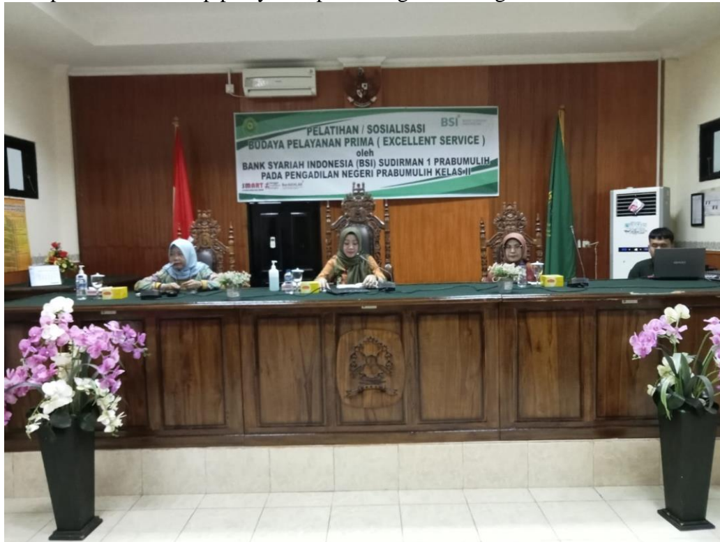
Foto pelatihan terhadap pelayanan pada Pengadilan Negeri Prabumulih: